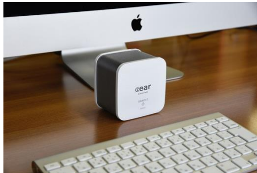
cear pavé GRAPHT Edition